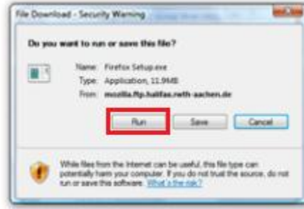
รูปที่ 3 ในกรณีที่ Internet explorer เวอร์ชันต่ำกว่า 9

3. จะปรากฏหน้าจอตั้งรูปที่ 3 หรือ 4 แล้วกด Run จากนั้นรอจนกว่าจะปรากฏหน้าจอตั้งรูปที่ 5